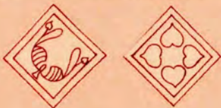
Могућа реконструкција подног мозаика из палате (цртеж З. Ђорђевић, Музеј Војводине)